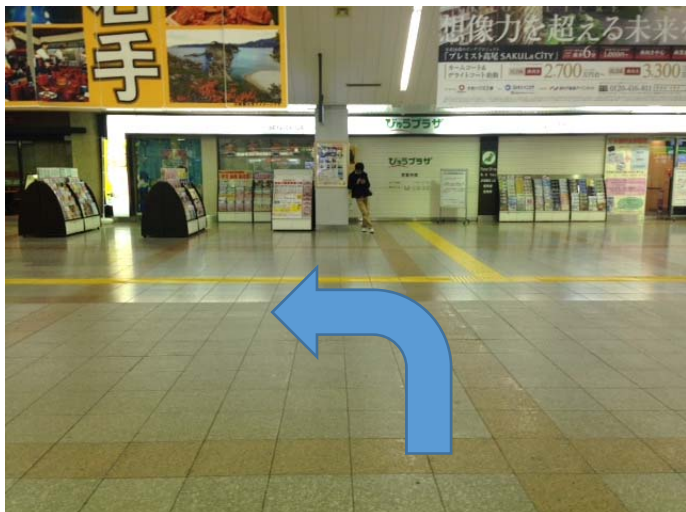
①改札を出て左方向へ