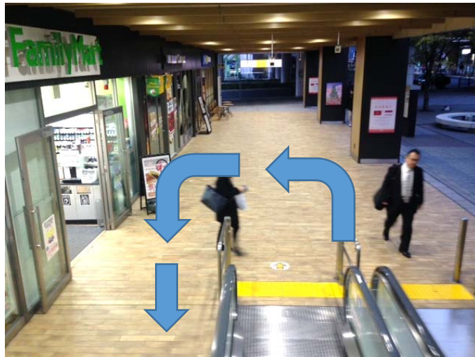
④エスカレーターを下りたら左手前方向へ