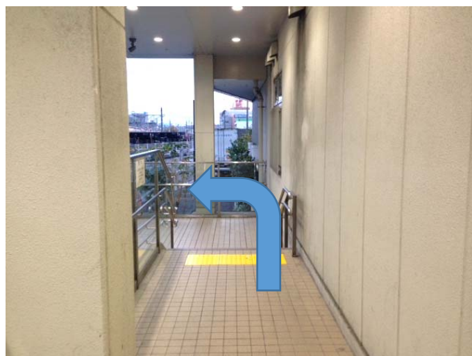
⑦突き当りを左方向へ