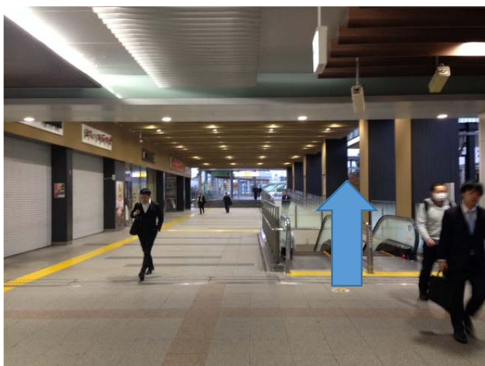
③エスカレーターを降りる