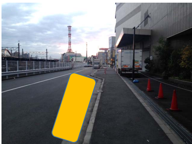
⑧すぐの左手がバス停