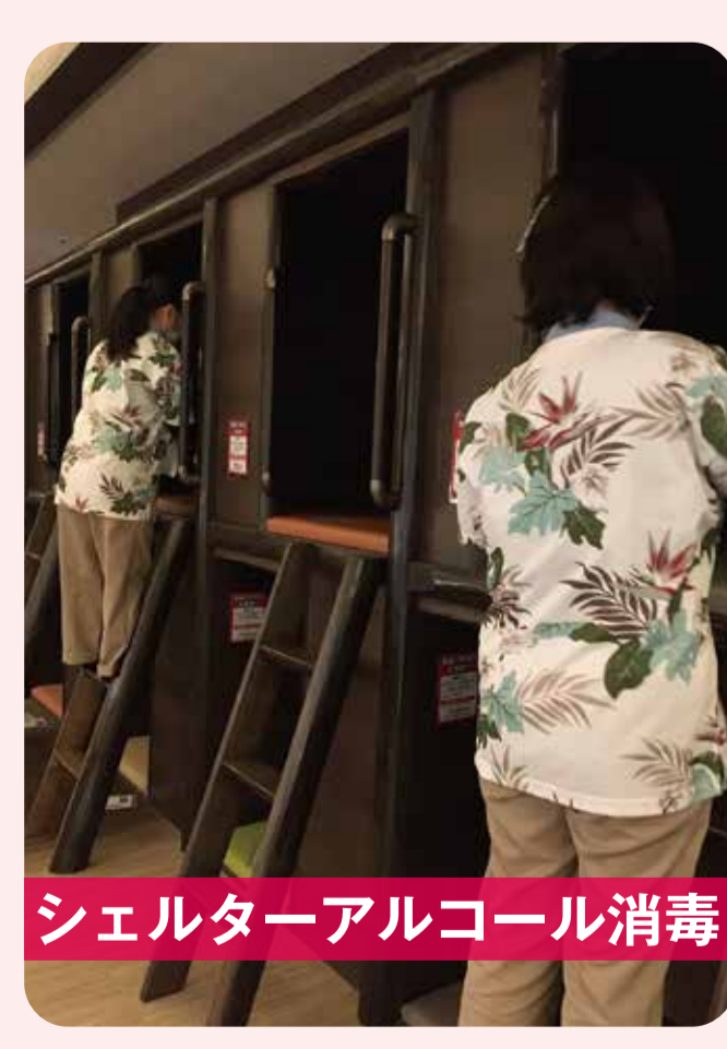
シェルターアルコール消毒