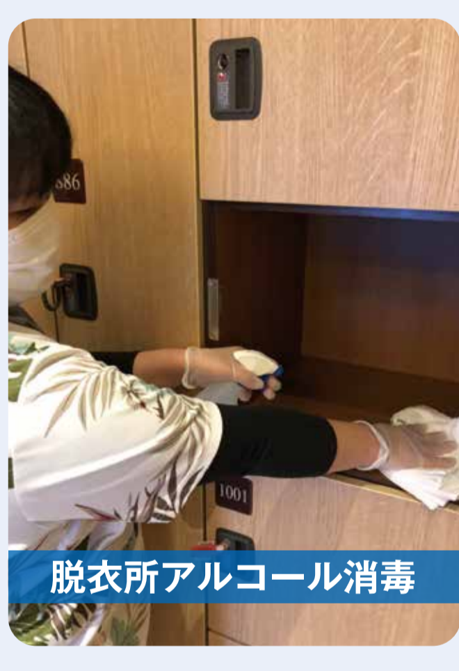
脱衣所アルコール消毒