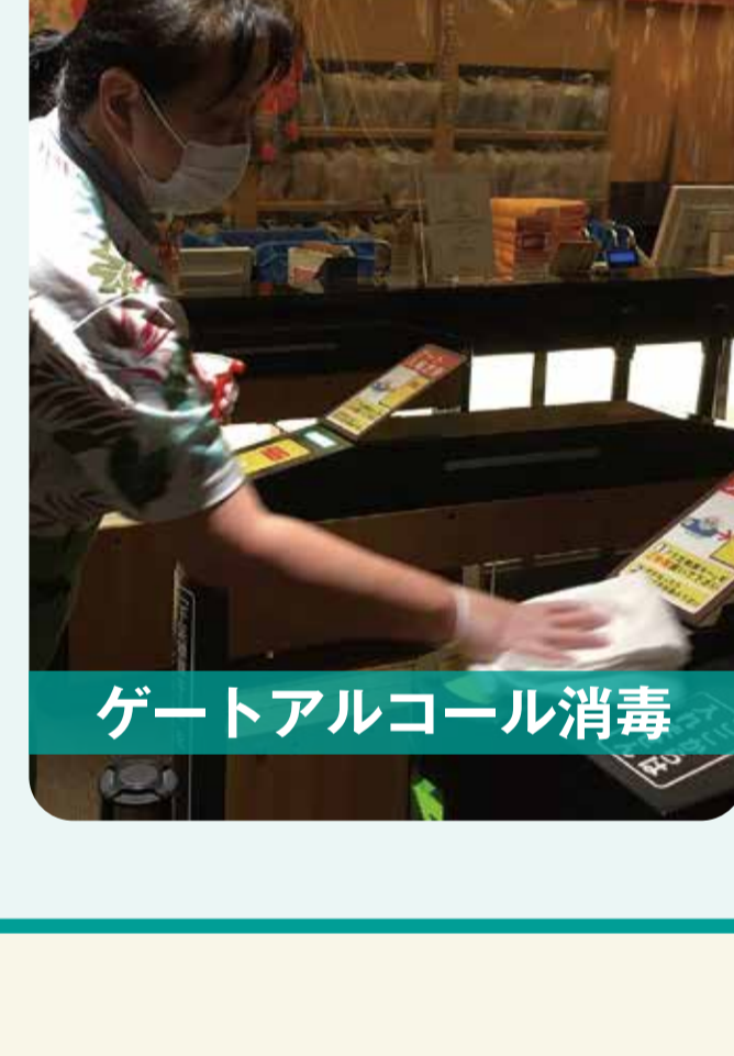
ゲートアルコール消毒