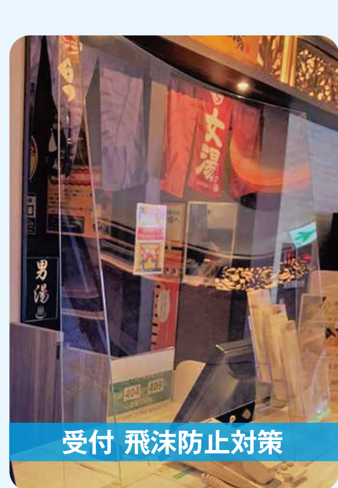
受付 飛沫防止対策