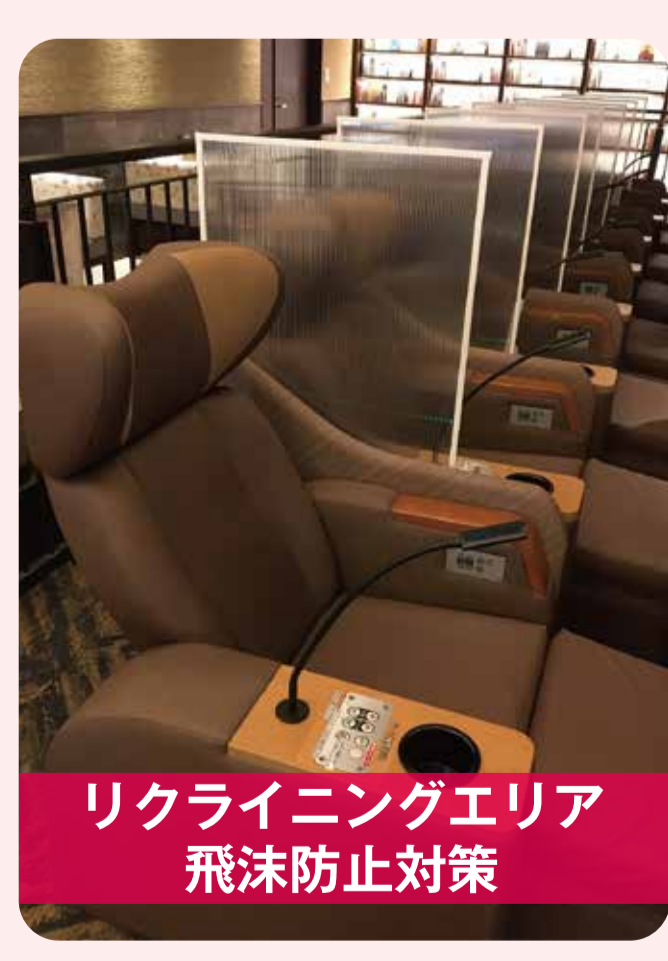
リクライニングエリア 飛沫防止対策