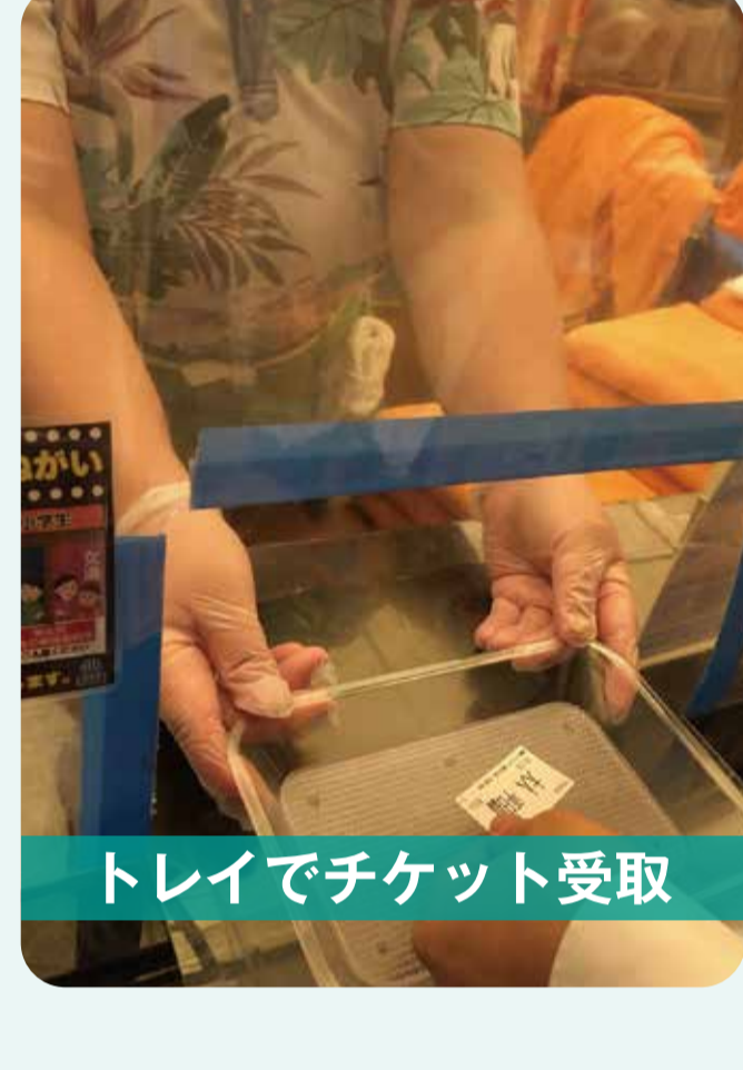
トレイでチケット受取