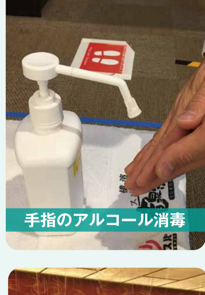
手指のアルコール消毒