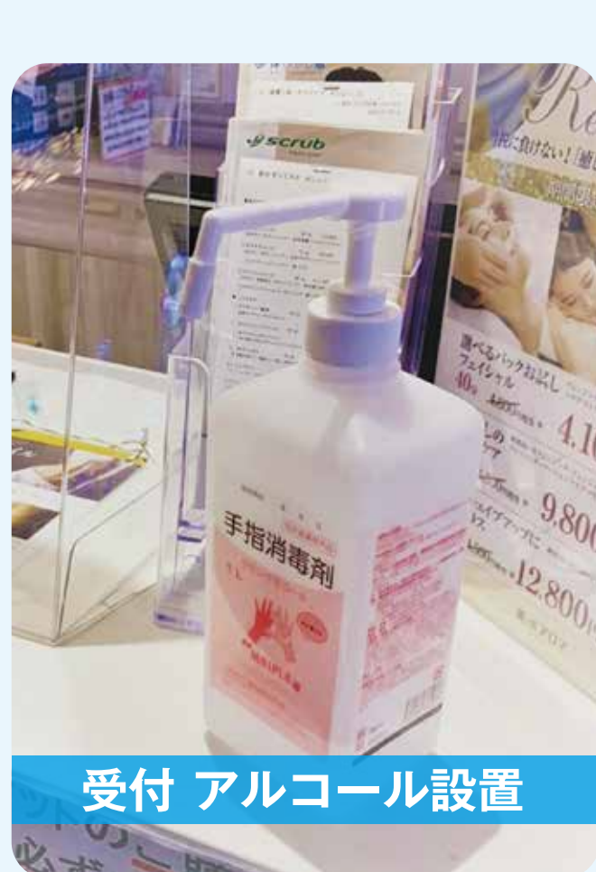
受付 アルコール設置