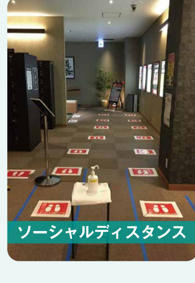
ソーシャルディスタンス