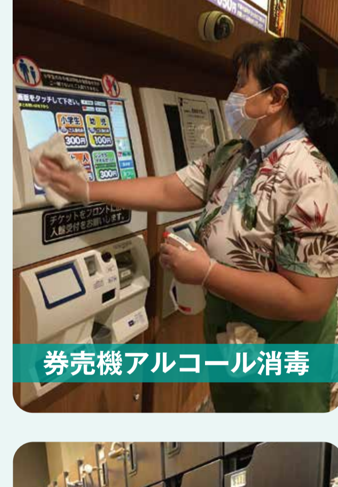
券売機アルコール消毒