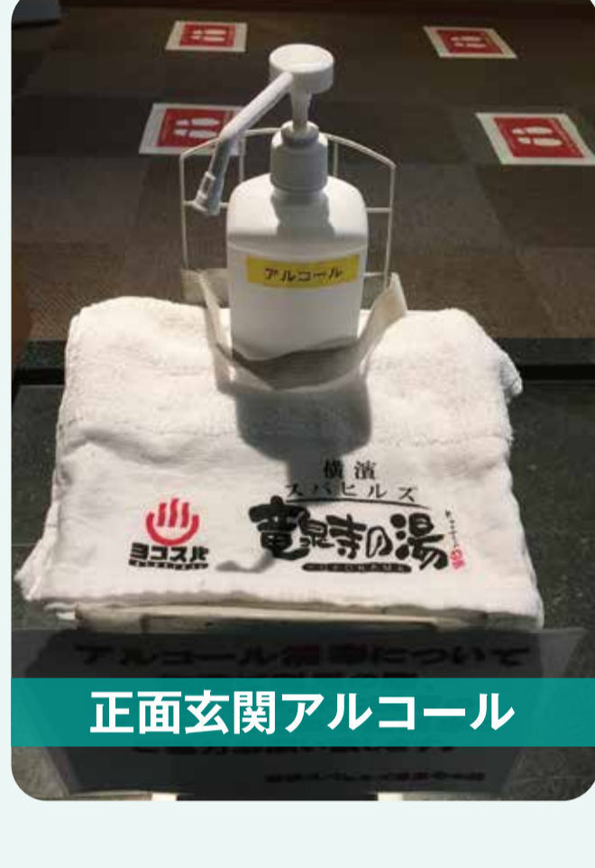
正面玄関アルコール