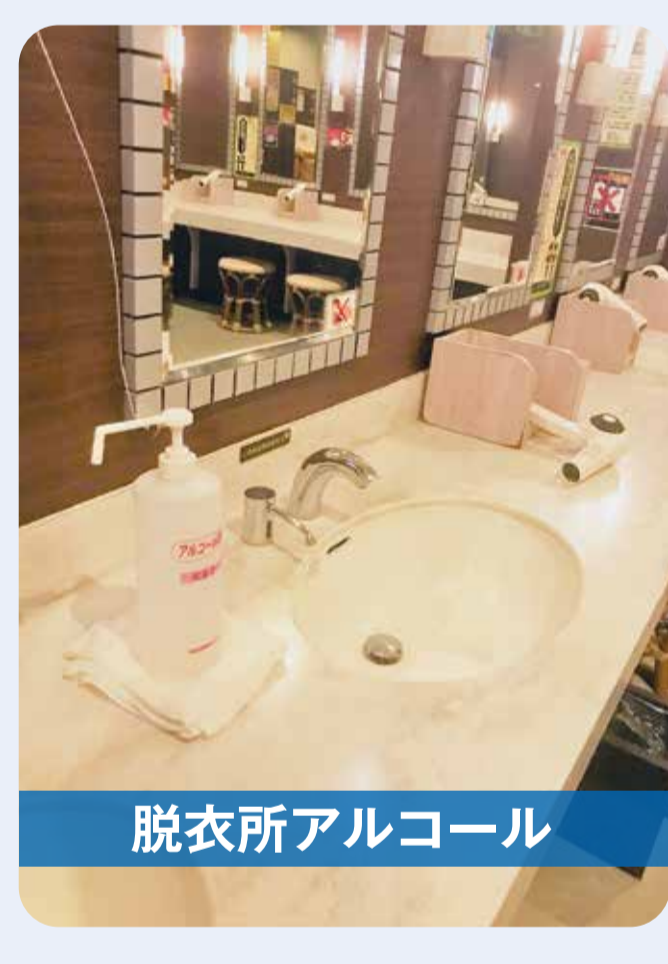
脱衣所アルコール