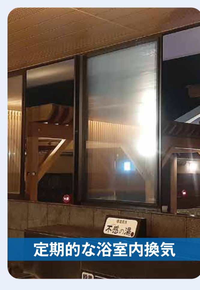
定期的な浴室内換気