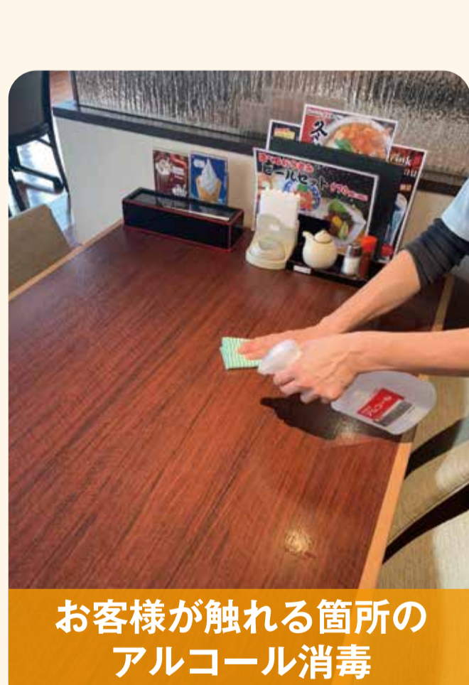
お客様が触れる箇所の アルコール消毒